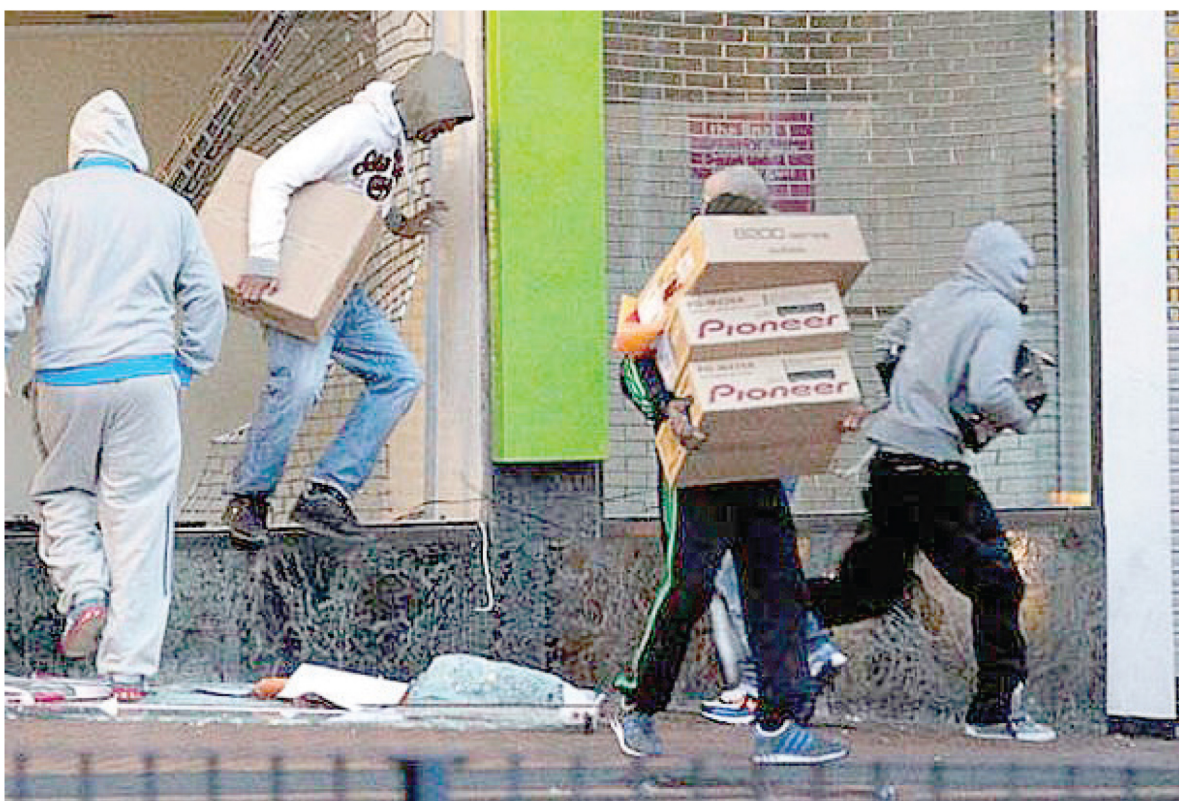
Nusikaltėlių į užsienį išvežti nepilnamečiai vagia viską: nuo parfumerijos, buitinės technikos iki automobilių.

Prekyba žmonėmis įgavo naują pobūdį: daugėja vaikų, išvežamų į užsienį daryti nusikaltimų, dažniausiai - vogti iš parduotuvių. Šis nusikalstamas virusas pasiekė ir mūsų rajoną: per dvejus metus į užsienį išvežti vagiliauti net trys nepilnamečiai ariogališkiai. Du iš jų išvežti pakartotinai ir šiuo metu sulaikyti užsienio šalyse.