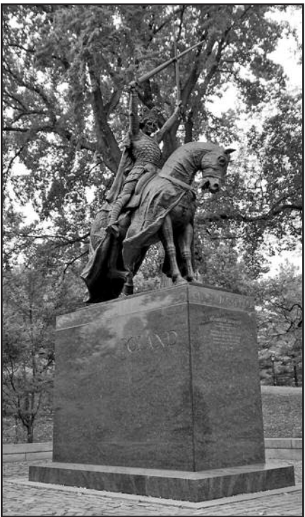
Jogailos skulptūrą Centriniam New Yorko miesto parke puošia Vyciai.

Nuoširdžiai tikėdami lietuviško paveldo svarba bei būtinybe jį išsaugoti, projekto „Tikslas – Amerika“ savanoriai nežada sustoti ir jau rengia kitų metų planą „Tikslas – Amerika 2018”. „Projektas dar nėra patvirtintas, tačiau paraiškoje yra numatyta ap-