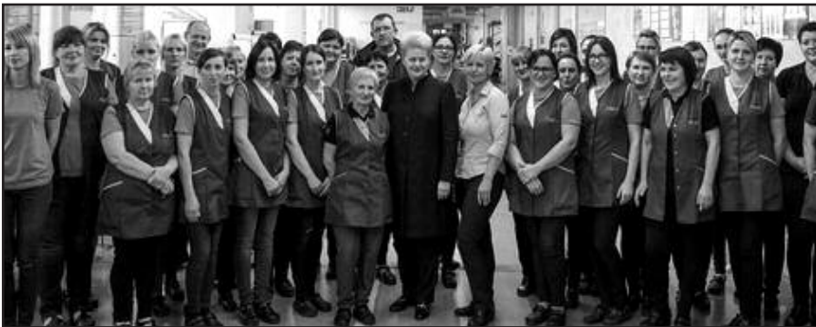
D. Grybauskaitė Tauragėje.