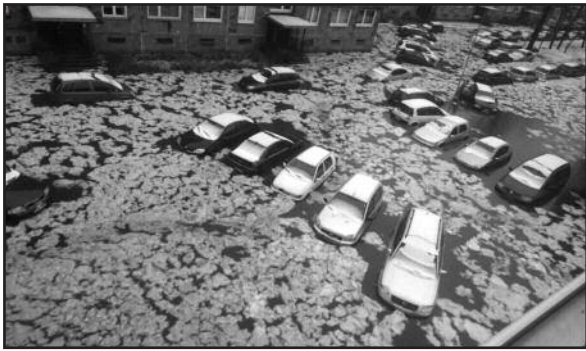
Manona, kad Klaipėdoje lietaus iš šlapdribos nuostoliai bus rekordiniai.

„Pirmadienį klaipėdiečiams teko susidurti su tikra stichija – gūsingam vėjui nudraskius medžių lapus užsikimšo miesto nuotekų sistema, o dėl gausios šlapdribos ir lietaus dalis gat-