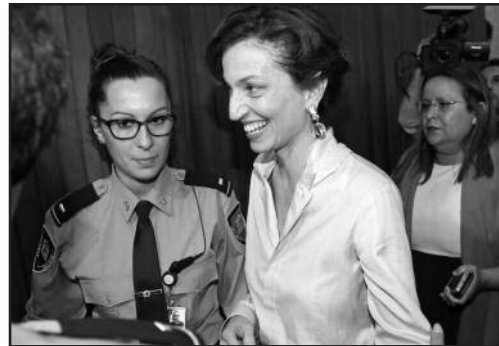
Naujoji UNESCO vadovė A. Azoulay nesureikšmina JAV pasitraukimo iš organizacijos.

Abi šalys spalio 12 dieną pranešė, kad visiškai palieka organizaciją, po