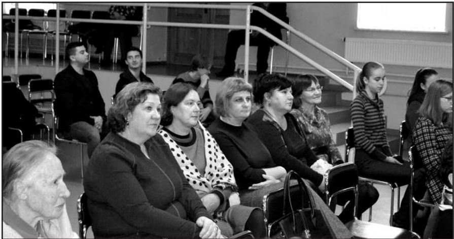
Sventinio renginio akimirka.

Kaimo biblioteka – bendruomenės gyvavimo centras, kuriame galima sužinoti naujausius Lietuvos ir pasaulio įvykius, rasti reikiamą informaciją, mėgstamą knygą. Tai erdvė, kur ne tik giliname savo žinias, bet ir keičiamės jomis su kitais, galime patenkinti savo poreikius.