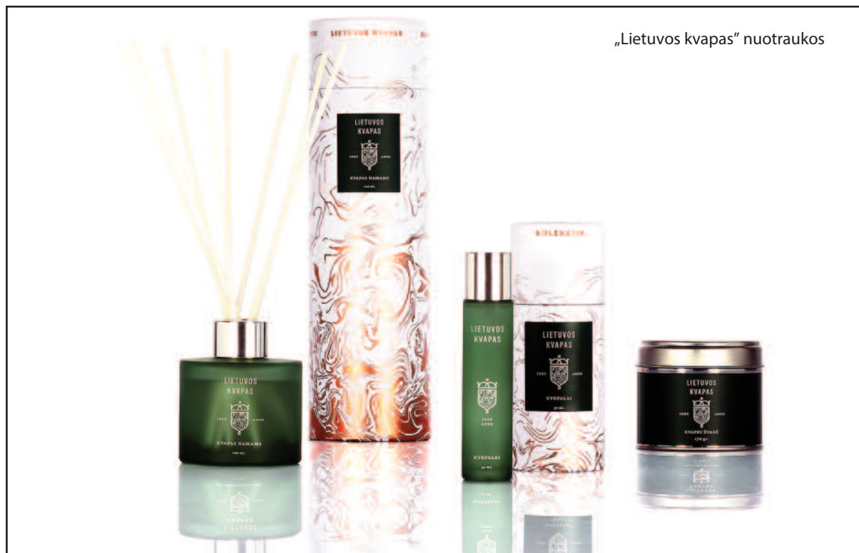
„Lietuvos kvapas“ nuotraukos

O išskirtinumo šioms kvepalams suteikia ne atskiri kvapai, bet jų kūrybos procesas, kurį mes apvertėme aukštyn kojomis. Paprastai parfumeriai pradžioje sukuria kvepalus, vėliau sugalvoja pavadinimą ir galiausiai sukuria istoriją kvepalų reklamai. Mes pradėjome nuo pavadinimo, vėliau – legendos. Parfumeriams, turintiems šią informaciją, teko neįprasta užduotis – sukurti patį kvapą. Iki to laiko jie