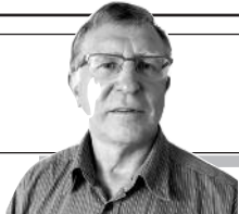
Parengė Vitalius Zaikauskas